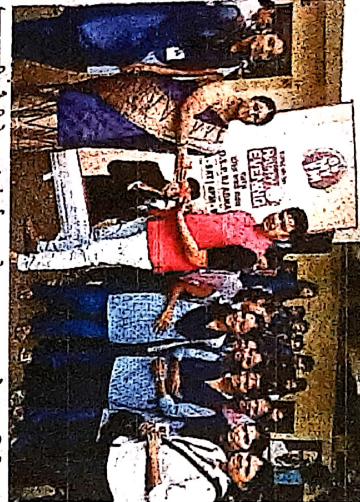
एक राखी फौजी के नाम अंतर्गत आरजे अभयला राखी देवाना भगिनी.