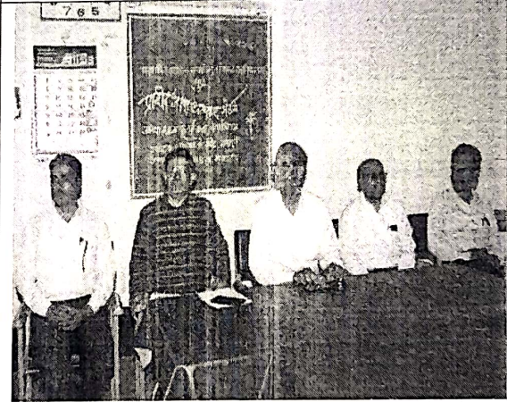
Hon. Guest present on Stage